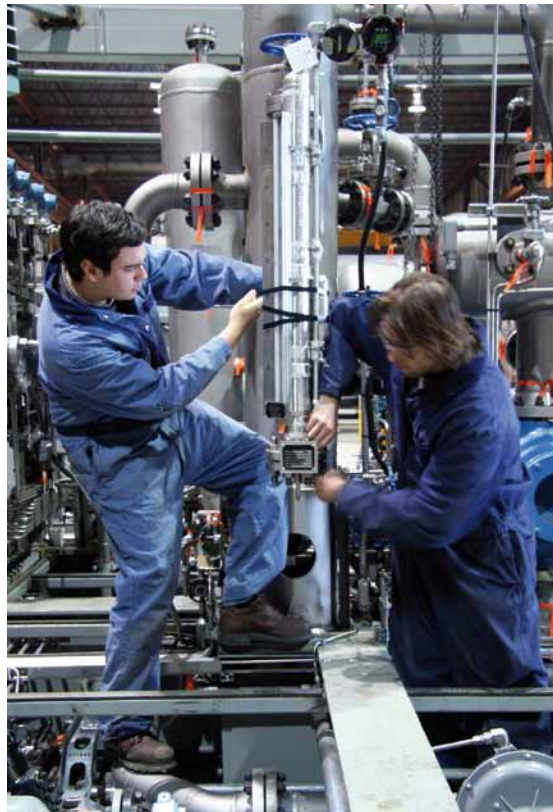
Wird 2010 Kurzarbeitergeld neu beantragt, gilt eine kürzere Bezugsdauer von maximal 18 Monaten.

Einen Monat später, am 01.02.2010, tritt das arbeitsrechtliche Verbot der sog. Gen-Schnüffelei in Kraft. Das Gendiagnos-