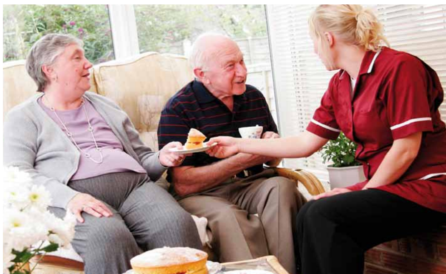
Die Leistungen der Pflegeversicherung wurden zum Jahreswechsel erhöht.

Die Kurzzeitpflege erhöht sich in allen drei Pflegestufen auf 1.510 EUR jährlich und die Beträge zur sog. Verhinderungs-