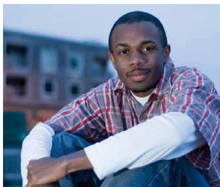
Für Flüchtlinge mit einer Arbeitserlaubnis auf Probe gilt jetzt ein verlängertes Bleiberecht.

Gute Nachrichten auch für Ausländer. Wer bislang nur eine Aufenthaltserlaubnis auf Probe besitzt, darf vorläufig länger in Deutschland bleiben. Das Bleiberecht für diese Personengruppe wurde um 2 Jahre bis Ende 2011 verlängert, so dass über 30.000 Flüchtlinge zunächst weiter geduldet und nicht abgeschoben werden. In dieser Zeit haben sie auch die Möglichkeit, sich um eine dauerhafte Aufenthaltserlaubnis zu bemühen.