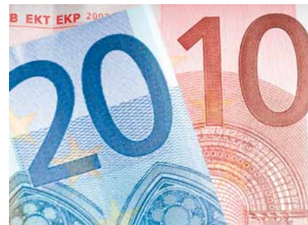
2010 sollen die Bürger finanziell entlastet werden.

In der Presse viel diskutiert wurde im Vorfeld die nun gültige Absenkung des Umsatzsteuersatzes für Beherbergungsleistungen aus dem Hotelgewerbe. Für die Übernachtung im Hotel beispielsweise fallen künftig nur noch 7% statt bislang 19% Umsatzsteuer